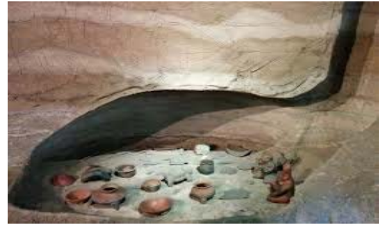
Tumba de tiro